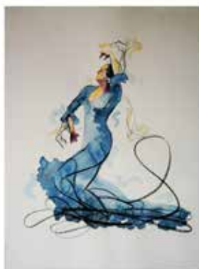
Estudios de movimiento de baile. Carbón y acrílico sobre papel 76 x 56 cm