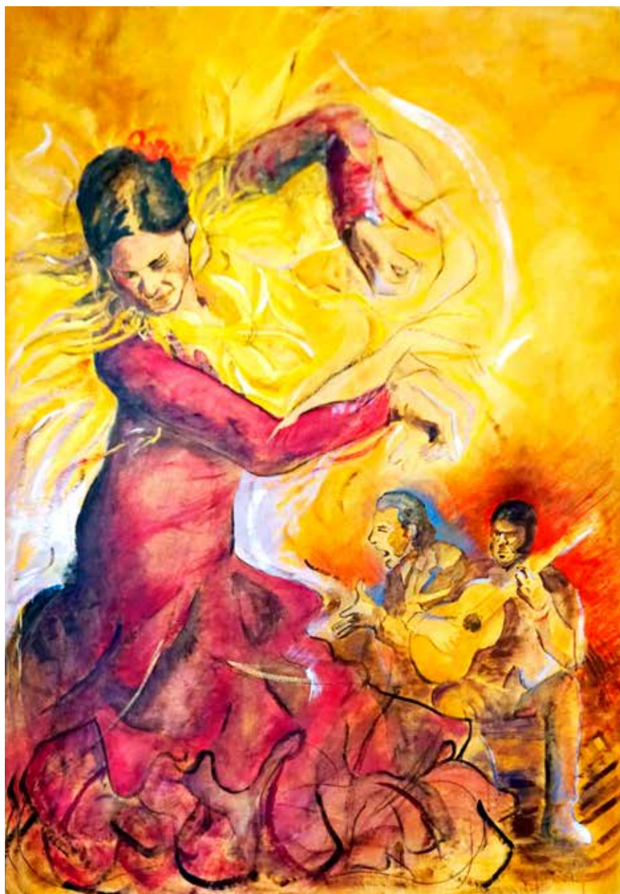
T. mixta sobre lienzo, 150 x 100 cm