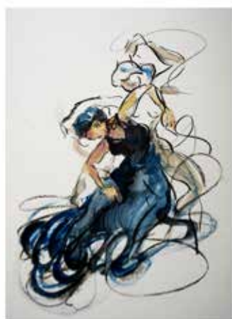
Estudios de movimiento de baile. Carbón y acrílico sobre cartón, 30 x 40 cm