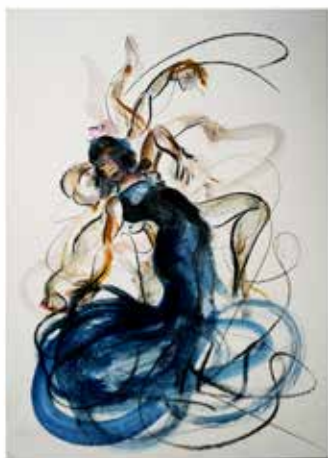
Estudios de movimiento de baile. Carbón y acrílico sobre cartón, 30 x 40 cm