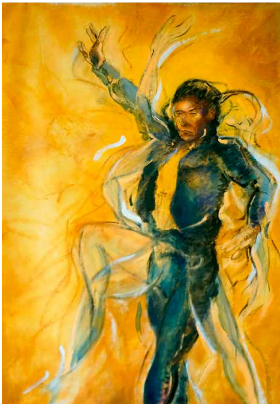
T. mixta sobre lienzo, 150 x 100 cm