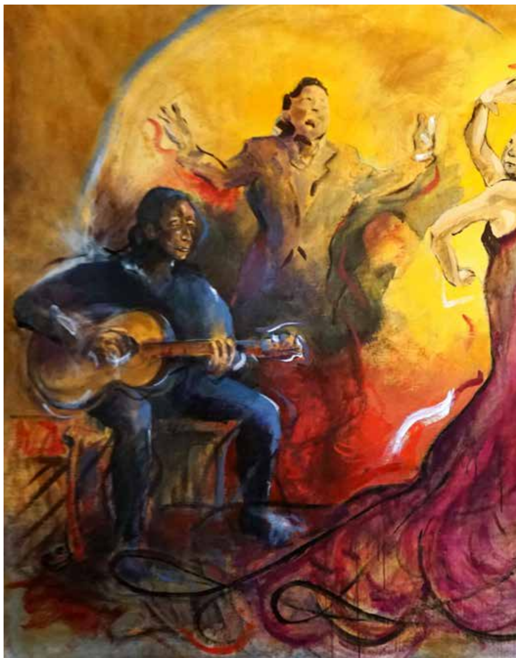
T. mixta sobre lienzo, 200 x 150 cm