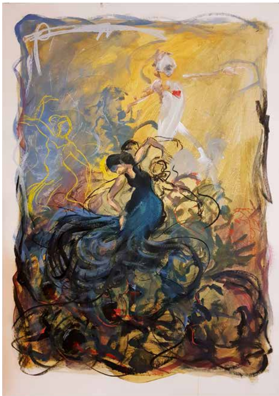
Acrílico, carbón y pastel sobre papel, 200 x 85 cm