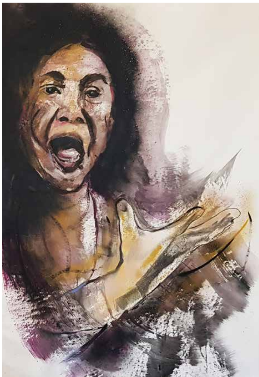
Ayeo. T. mixta sobre papel 150 x 106 cm