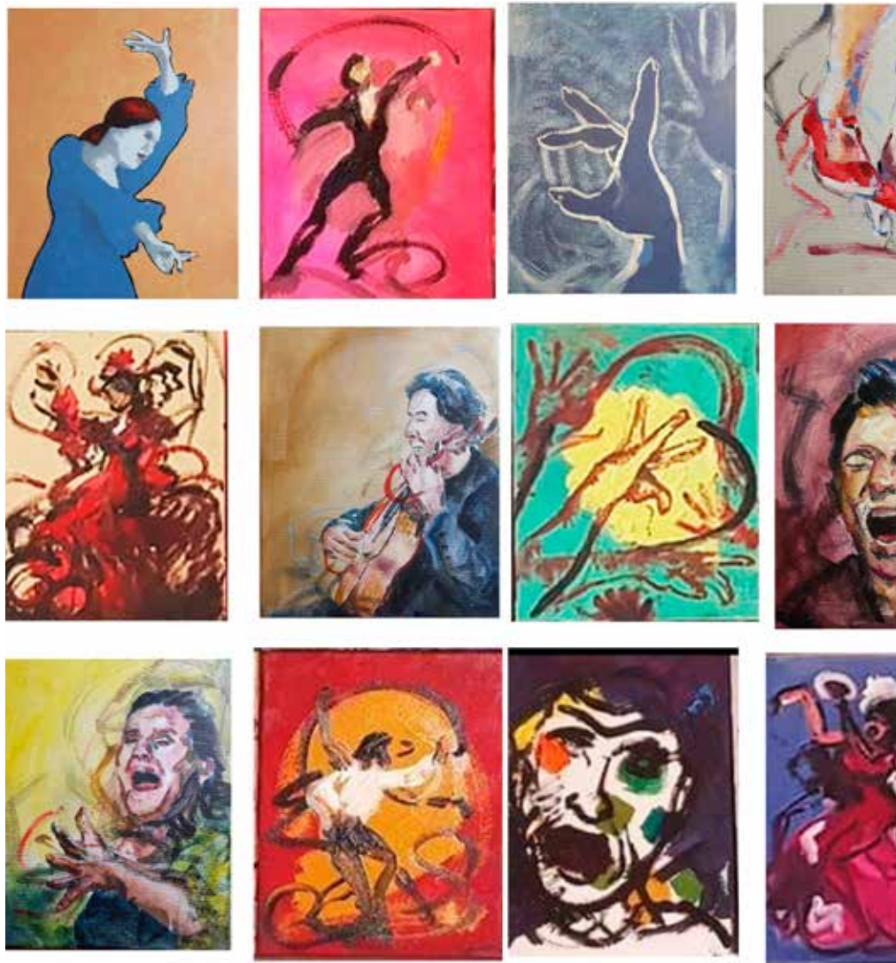
Políptico de 50-100 piezas de 27 x 22 cm. Óleo sobre lienzo. Dimensiones variables.