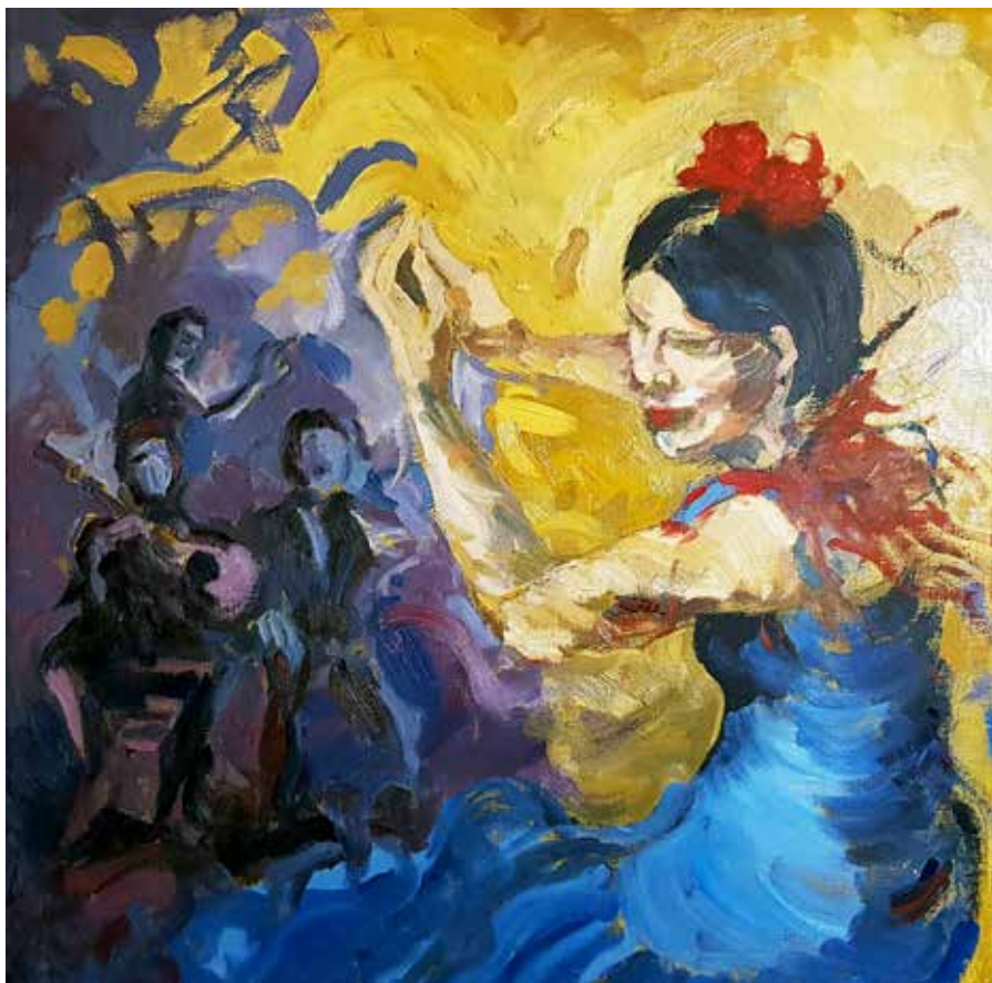
T. mixta sobre lienzo, 70 x 70 cm