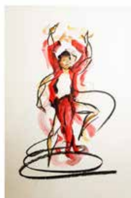
Estudios de movimiento de baile. Carbón y acrílico sobre papel 45 x 30 cm