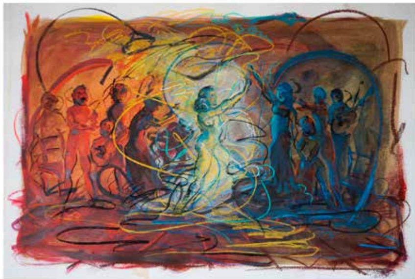
Técnica mixta sobre papel, 70 x 100 cm