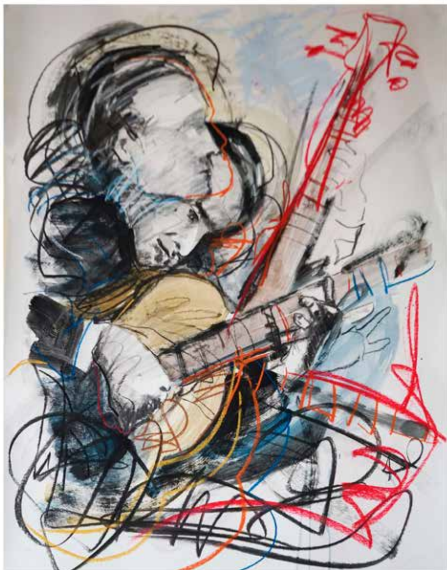
Tío Sabas . T. mixta sobre papel, 90 x 168 cm