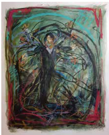
Técnica mixta sobre papel, 45 x 65 cm