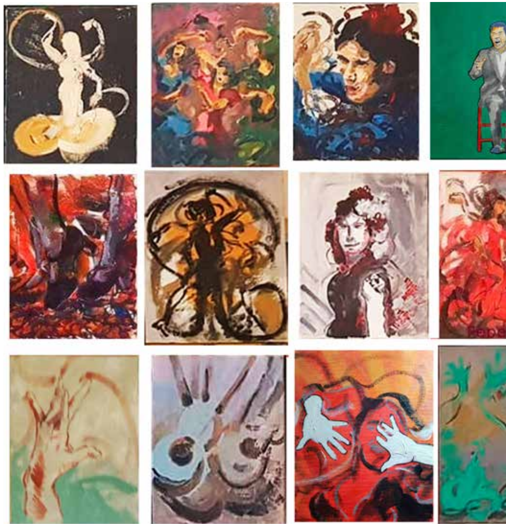
Políptico de 50-100 piezas de 27 x 22 cm. Óleo sobre lienzo. Dimensiones variables.