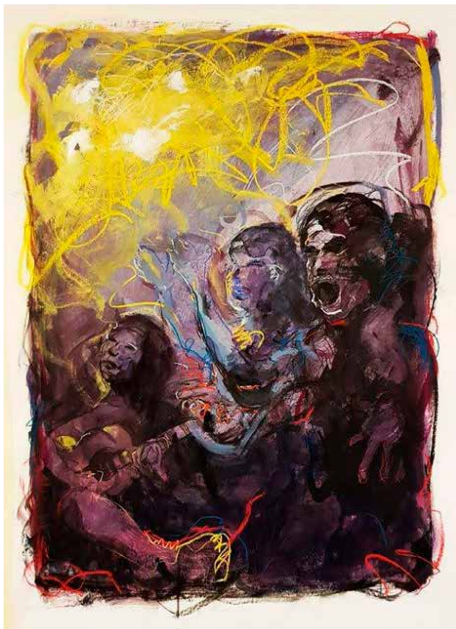
Acrílico, carbón y pastel sobre papel, 100 x 85 cm